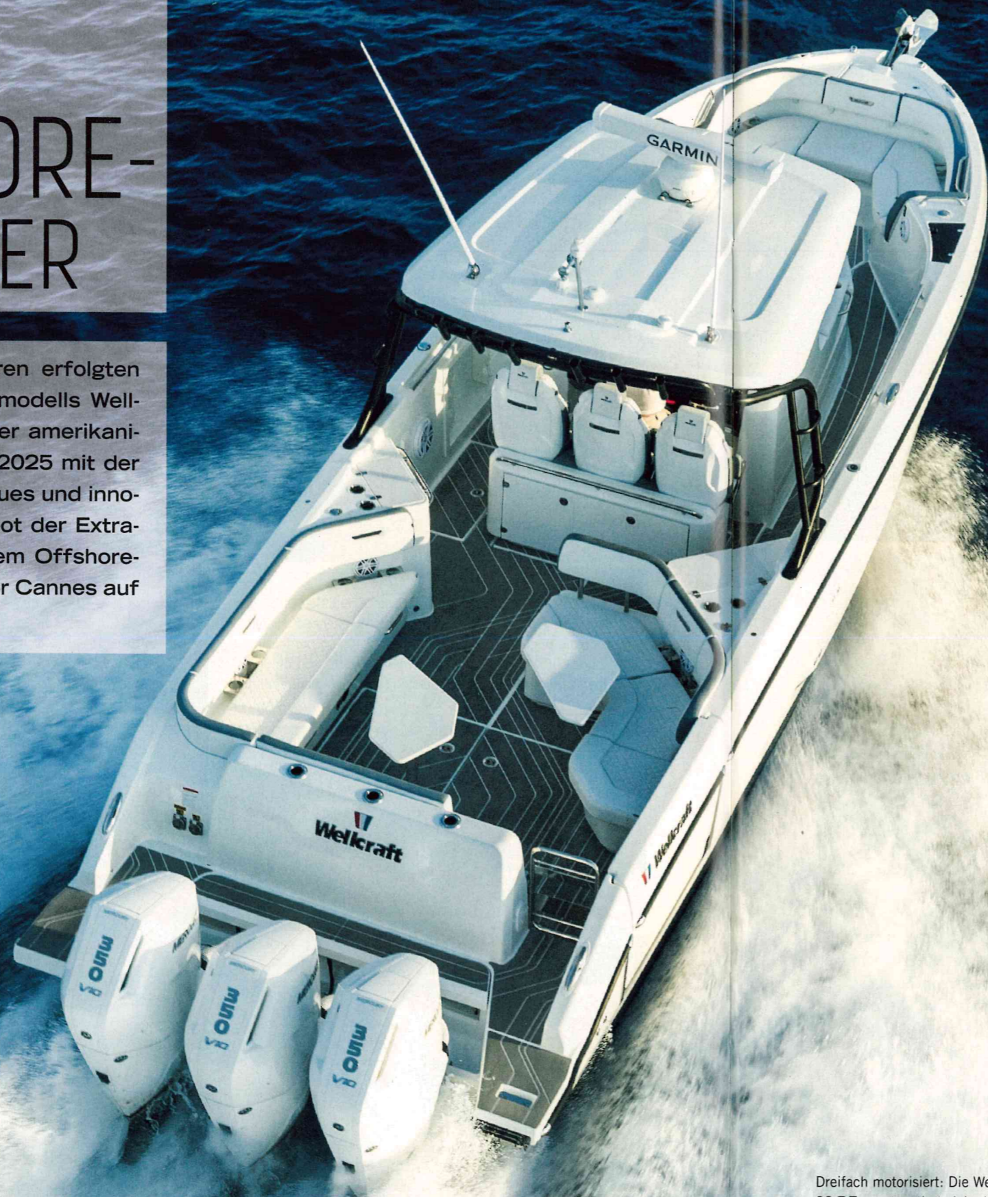
Dreifach motorisiert: Die Wellcraft 38 T-Top präsentiert sich als ausgereiftes Offshore-Boot und erreicht mehr als 52 kn Maximum Speed